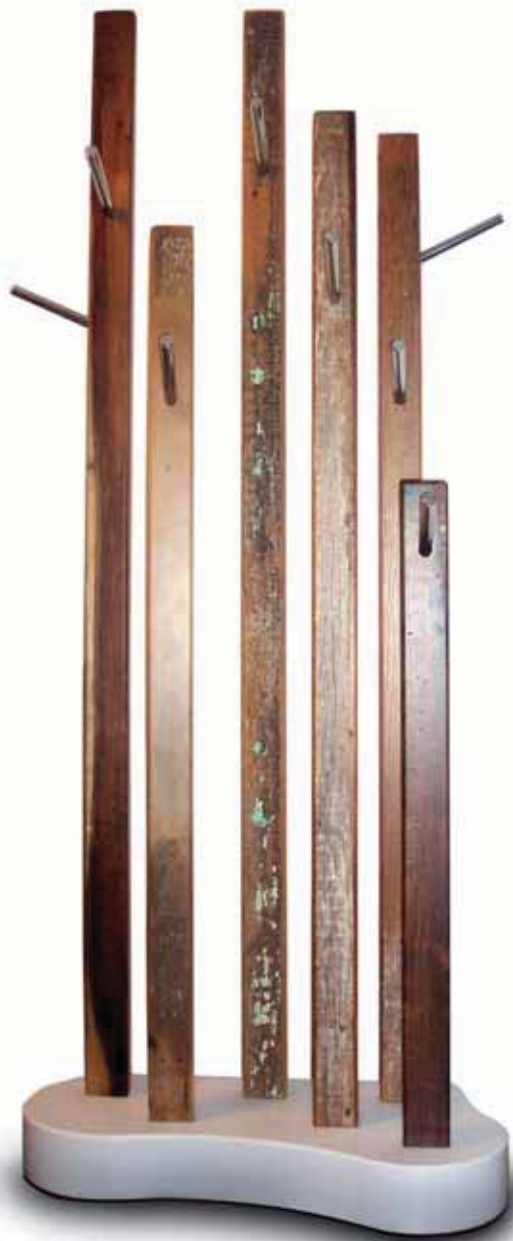
BOSQUE, BELÉN ANDREU PROYECTO DE ESTUDIANTE EN COLABORACIÓN CON ECO-HABITATGE, UTILIZANDO MADERA BRASILEÑA RECICLADA STUDENT PROJECT IN COLLABORATION WITH ECO-HABITATGE USING RECYCLED BRAZILIAN TIMBER INGENIERIA TÉCNICA EN DISEÑO INDUSTRIAL UNIVERSITAT JAUME I, VALENCIA WWW.ECOHABITATGE.COM